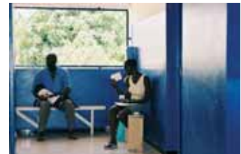
Flur im Hospital