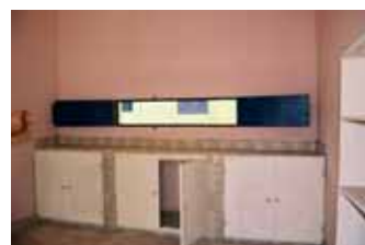
Durchreiche der neuen Apotheke