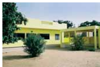
Blick auf Hospital & Wartesaal