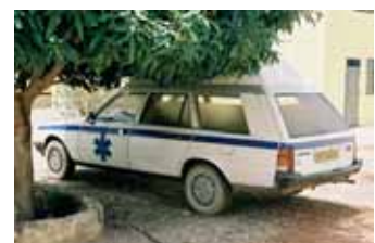
der neue Krankenwagen