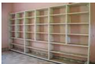
die neu ausgebaute Apotheke