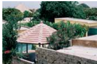
Blick auf das Hospital